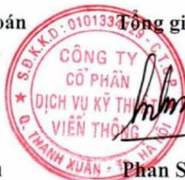
Phan Sỹ Kiên

Chứng chỉ ISO 9001:2008 (được cấp bởi TUV-NORD ngày 10/04/2015).